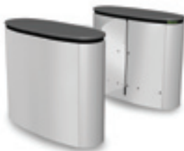
SmartLane 910 Afmetingen*: 1200 x 1800 mm (47" x 70 7/8 "