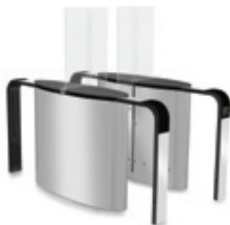
SmartLane 902 met uitgebreide toegangs-/ uitgangcontrole Afmetingen*: 2000 x 1200 mm (78 3/4 " x 47")