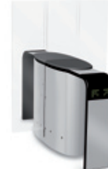
SmartLane 912 Twin met uitgebreide toegangs-/ uitgangcontrole en compacte afmetingen Afmetingen*: 2000 x 1450 mm (78 3/4 " x 57")