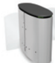
SmartLane 910 Twin met compacte afmetingen Afmetingen*: 1200 x 1450 mm (47" x 57")